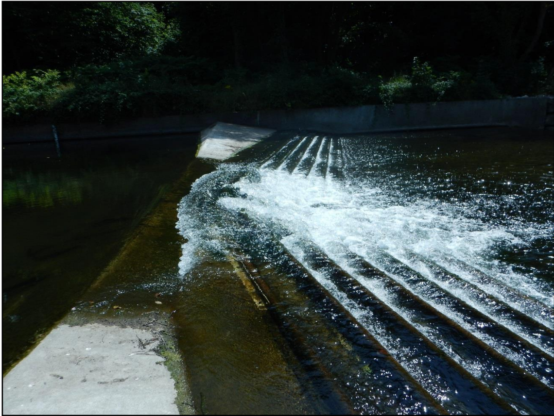
Datrysiad baffl cost isel yng nghored fedryddu Resolfen – Afon Nedd 2017