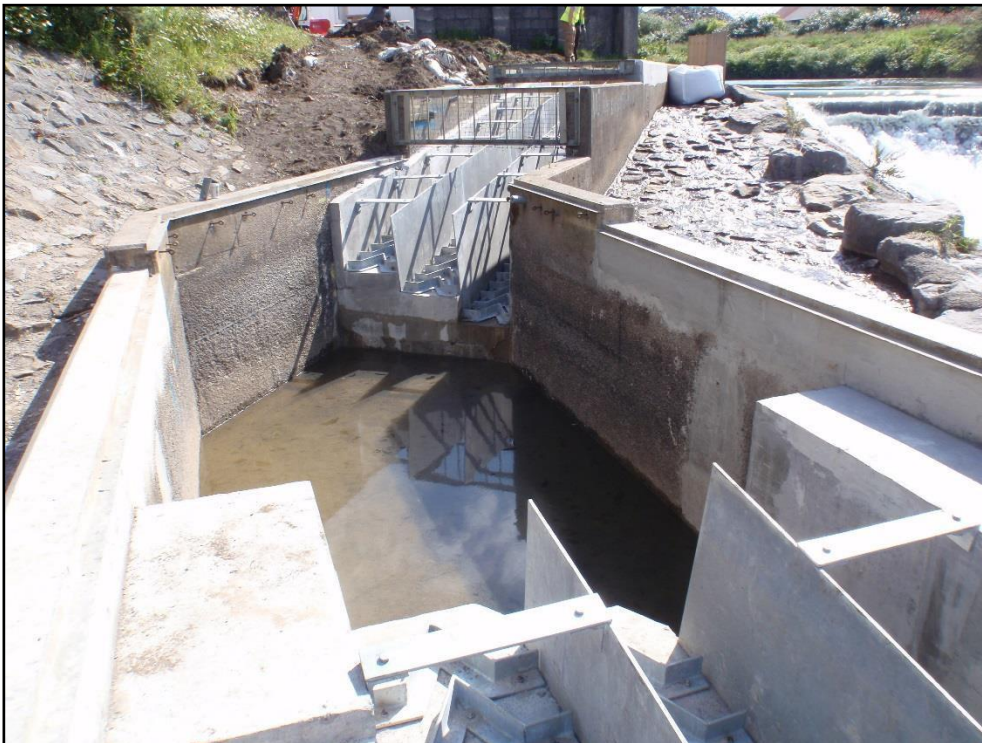
Llwybr pysgod Larinier dwy ran arloesol – Afon Afan 2015